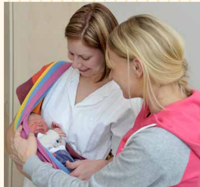
Mehr als 11.000 Kufsteiner Babys kamen bisher im neuen A. ö. BKH Kufstein zur Welt.

1999 nahm das neu errichtete Allgemein öffentliche Bezirkskrankenhaus Kufstein seinen Betrieb am Standort Endach auf. Fünf Jahre Bauzeit und ein Investitionsvolumen von mehr als 100 Millionen Euro, getragen von den 30 Gemeinden des Bezirkes sowie von Bund und Land, waren der Eröffnung vorausgegangen. Als einer der jüngsten Krankenhausbauten zählt das A. ö. BKH Kufstein auch heute noch zu den modernsten Spitälern Österreichs. Erfahrene, hochspezialisierte Ärzte und ein ebenso kompetentes Pflegeteam ermöglichen, dass nahezu alle Verletzungen und Erkrankungen wohnortnah im Bezirk diagnostiziert