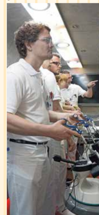
Wie Ärzte können Besucher im PROF ED MOBIL eine virtuelle OP durchführen.

Operiert wird im A. ö. BKH Kufstein nach den modernsten Verfahren der Medizin. Dazu zählt z. B. die sogenannte Schlüssellochchirurgie, bei der mit Sonden und