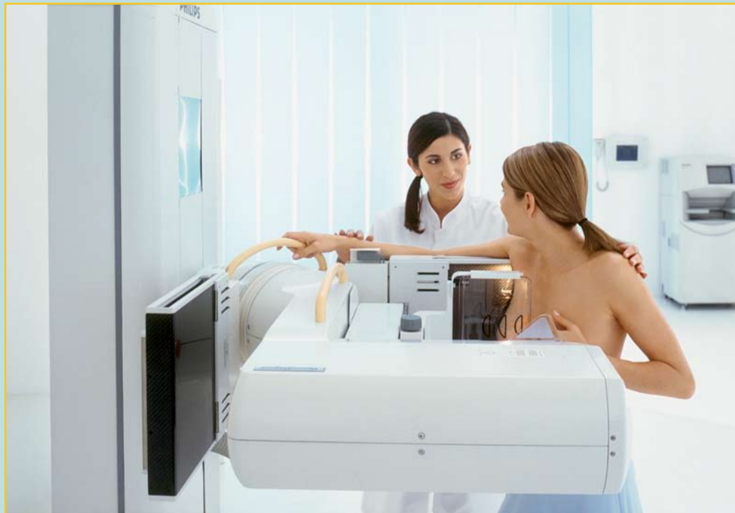
Bei der Mammographie wird an einem speziellen Gerät ein Röntgenbild der Brust erstellt.

Patientin restlos Klarheit! Leider erkrankt fast jede neunte Frau in Österreich im Laufe ihres Lebens an Brustkrebs. Niemand kann wissen oder vorhersagen, wer betroffen sein wird. Deshalb ist eine rechtzeitige Erkennung so wichtig. Mit den uns heute am BKH Kufstein zur Verfügung stehenden, modernen Untersuchungsmethoden sind wir in der Lage, Brustkrebs früher zu erkennen und in den meisten Fällen auch zu heilen.