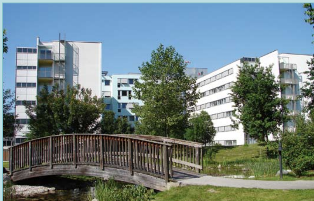
Mit Unterstützung der Gemeinden und einem überlegten Umgang mit den finanziellen Ressourcen können die Ärzte des BKH Kufstein schwerkranken Menschen wieder Hoffnung geben.

kungen – auch jede Form der modernen medikamentösen